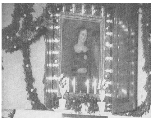
Fot. 3. Zdjęcie przedstawiające jubilatów górniczych w Barbórkę 4 grudnia 1933 r. (Werkszeitung der Schlesischen Bergwerks- und Hütten-Aktiengesellschaft in Beuthen O/S., 1933, 5: 6)