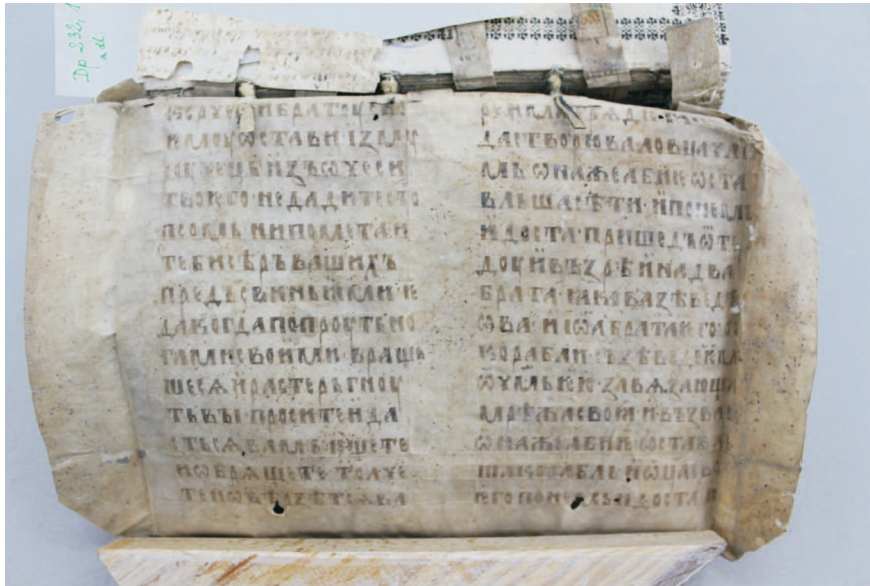
II. 1. Fragmenty Ewangelii Mateusza (7.4-7.7 i 4.19-4.22) z Ewangeliarza aprakos [XIV w.], pergamin użyty do oprawy klocka introligatorskiego [XVII w.]