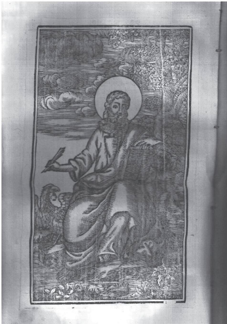
Il. 3. Ewangelista Jan, drzeworyt z datą „1748” i inicjałami „I.G.” (Iosif Goczemskij) z Ewangeli , [Poczajów, Drukarnia Bazyliańców, 1818]