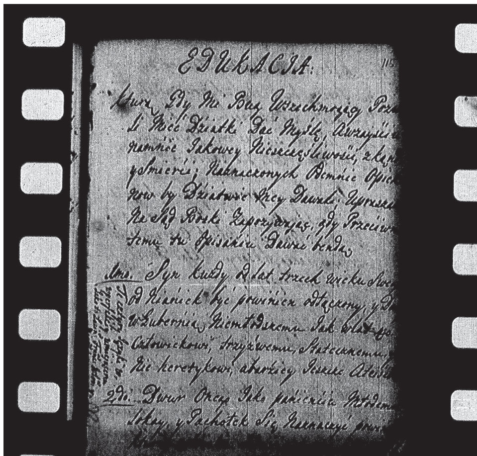
Fotokopia strony tytułowej Edukacja , którą gdy mi Bóg wszechmogący pozwoli mieć działki, dać myślę [...] , sygn. 1721 II, k. 115.

Omawiane teksty zostały wydane w opracowaniu Marii Brzeziny 2 . W niniejszym artykule wykorzystano jednak rękopisy, gdyż są one najlepszym źródłem poszukiwania cech charakterystycznych dla języka autora. Celem artykułu jest więc wskazanie najważniejszych właściwości języka Hieronima Floriana (ze szczególnym uwzględnieniem elementów kresowych) na podstawie ww. rękopisów.