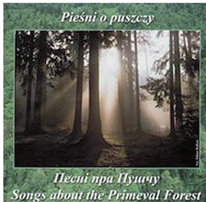
Okładka płyty CD Pieśni o Puszczy , Fundacja „Muzyka Cerkiewna” 2006, [online] < http://festiwal-hajnowka.pl/cpr/index.php?str=piesni_o_puszczy.html > (30.07.2013)

Podsumowując, obecność Feliksa i Rudolfa Nowowiejskich w środowiskach twórczych Europy Wschodniej odegrała ważną rolę. Postaci te wpisały się w zawiłe dzieje Kresów Wschodnich, wzbogacając historię kultury, zwłaszcza muzycznej, w okresie II Rzeczypospolitej. Brak jednak szerszego upowszechnienia i uznania ich działalności w tym względzie. Z dzisiejszej perspektywy aktywność i dorobek artystyczny braci Nowowiejskich jest elementem łączącym kulturę i narody, Zachód ze Wschodem. Podobnie jak wspomniany w artykule projekt między Polską a Białorusią, który nie tylko przypomina o muzycznych tradycjach wielokulturowego regionu, ale również dowodzi, że muzyka może łączyć, a nie dzielić.