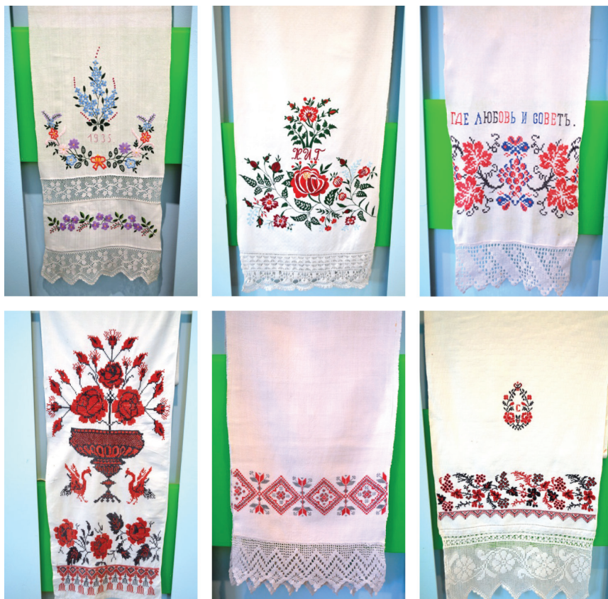
Ryc. 1. Białoruskie ręczniki obrzędowe z terenów Podlasia