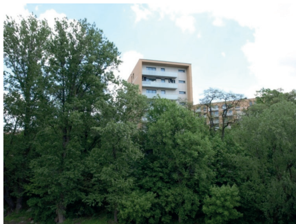
Rys. 3. Dobrze zachowany zespół zieleni wzdłuż linii brzegowej wyspy

Oprócz zachowania nadbrzeżnych pasów szaty roślinnej istotne byłoby uzupełnienie istniejących zespołów zieleni nowymi – o odpowiednio dobranym składzie gatunkowym i kompozycyjnie harmonizujących z nową architekturą. Zapis w jednym