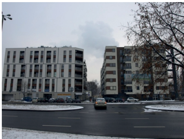
Rys. 4. Konsekwencje braku jednolitego planu zagospodarowania przestrzennego