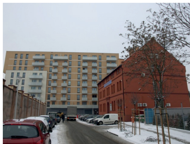
Rys. 5. Brak harmonii kompozycyjnej między nową architekturą i starą zabudową

Niestety, w realizowanych inwestycjach trudno dostrzec podjęty dialog między nową zabudową a chronionymi w przestrzeni wyspy budynkami (rys. 5).