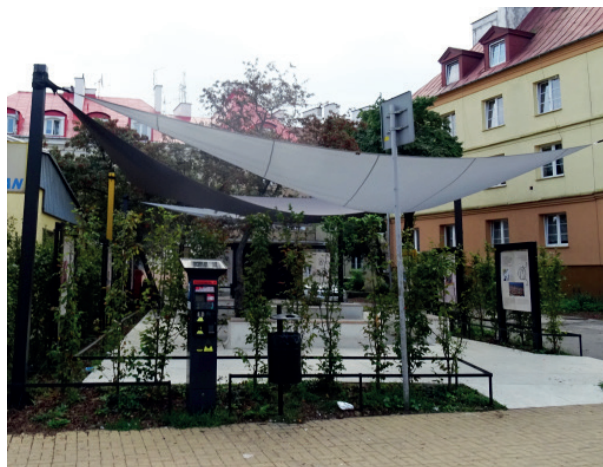
Rys. 7. Zielona sala wykładowa na Starym Mieście w Lublinie