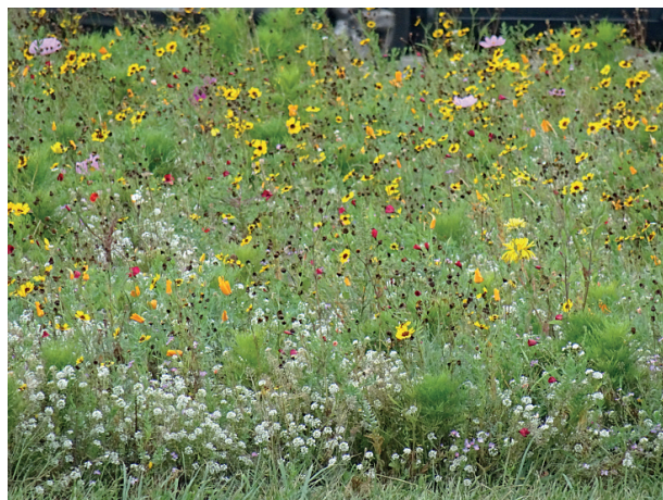
Rys. 5. Łąka kwietna w centrum Lublina