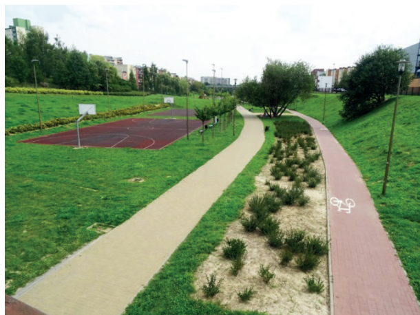
Rys. 4. Park Jana Pawła II w Lublinie