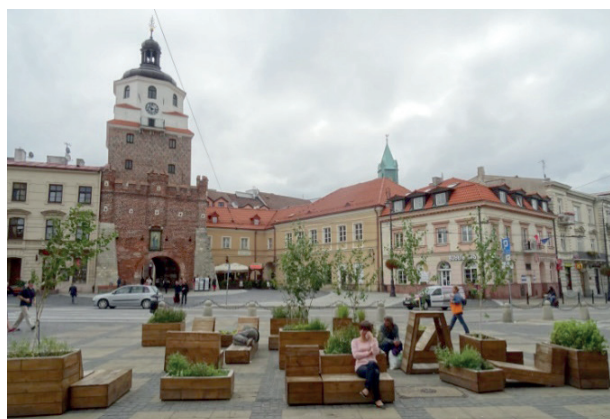
Rys. 6. Parklet przy pl. Łokietka w Lublinie