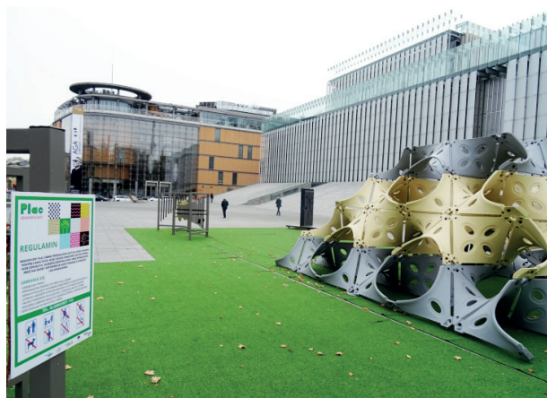
Rys. 2. Plac Teatralny w Lublinie z fragmentem „sensorycznego placu zabaw”