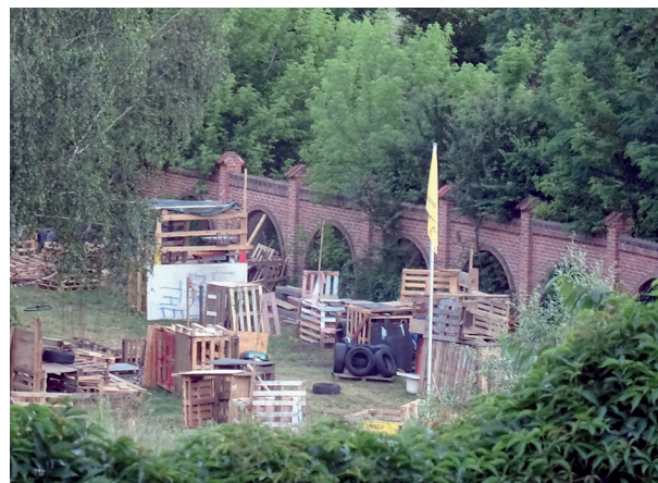
Rys. 3. „Rezerwat Dzikich Dzieci” w Lublinie