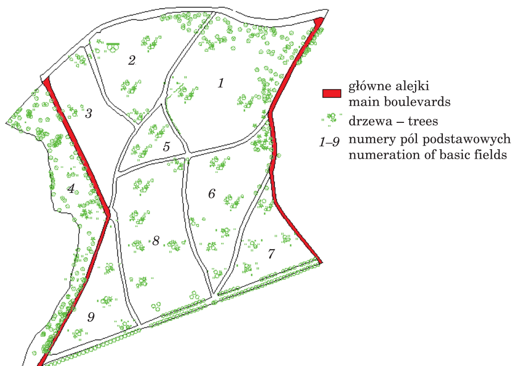
Rys. 1. Podział parku na pola podstawowe

W celu ułatwienia oceny park podzielono na 9 pól podstawowych, które wydzielono według głównych chodników i alejek przebiegających na jego terenie (rys. 1).