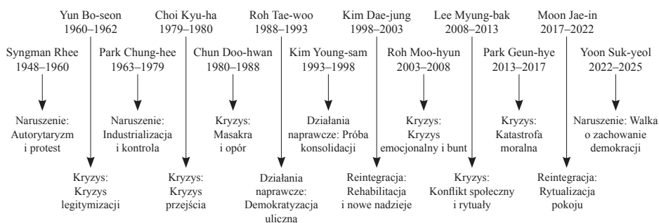
Wykres 1. Poszczególne fazy koreańskich prezydentur na przestrzeni lat (1948–2025)