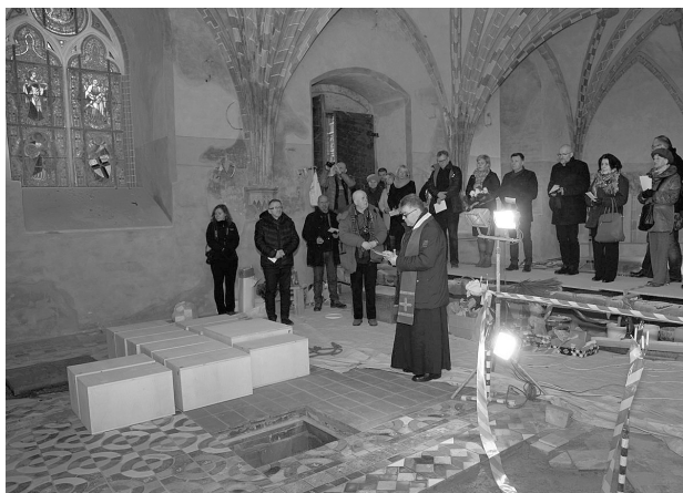
Ryc. 5. Ponowny pochówek jezuitów i rodziny starosty Rexina w kaplicy św. Anny w Malborku (16 III 2016 r.)

Interpretowanie oznacza najpierw zrozumienie na własny sposób, a następnie wyjaśnianie, przybliżanie znaczeń i tłumaczenie. Według Freemana Tildena celem interpretacji jest ujawnienie znaczeń i relacji, dokonywane w bezpośrednim doświadczaniu 79 . Jest więc czymś zasadniczo innym niż proste przekazywanie informacji opartych na faktach. W takim ujęciu kluczowe znaczenie dla interpretacji ma przekazywanie i pozyskiwanie doświadczeń na temat dziedzictwa i budowanie relacji między nim a jej odbiorcami. W takiej perspektywie wydaje się, iż opisywane dzieje pochówków w malborskiej kaplicy św. Anny zasługują na reinterpretację dotychczasowej wiedzy. Z jednej strony sugerują to ostatnio zakończone prace konserwatorskie, poprzedzone żmudnymi badaniami archeologicznymi. Po wtóre, współcześni turyści są nastawieni raczej na osobiste przeżycia, a także oczekują możliwości zmierzenia się z ciągle obecną i żywą historią, co niejako wzmacnia oddziaływanie konkretnej atrakcji turystycznej.