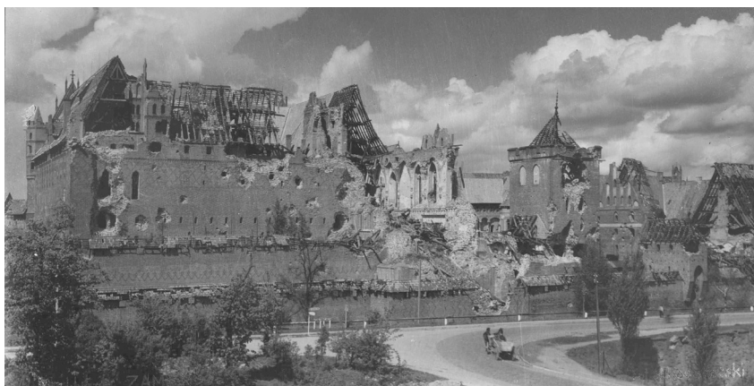
Ryc. 1. Zniszczenia zamku malborskiego w 1945 r. widokówka z 1946 r.