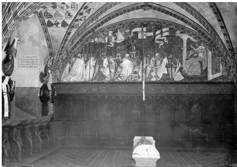
Ryc. 4. Wnętrze kaplicy św. Anny w 1904 r. ( Wiederherstellung der Marienburg. Baubericht in Bildern , 1904, Marienburg 1904, il. 13)