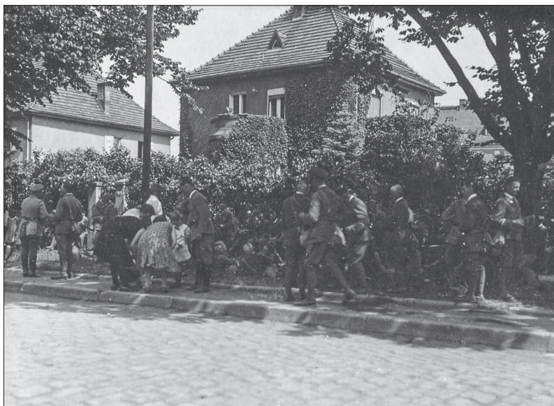
Fot. 2. Zjazd Stahlhelmu we Wrocławiu w 1931 r.