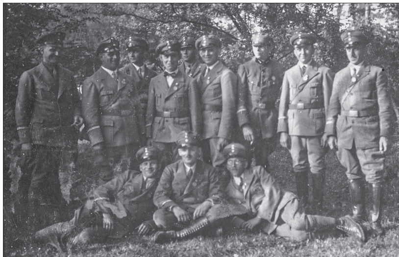
Fot. 1. Zjazd Stahlhelmu we Wrocławiu w 1931 r.

Edytowane dokumenty przechowywane są w zbiorach Centralnego Archiwum Wojskowego – Wojskowego Biura Historycznego im. gen. broni Kazimierza Sosnkowskiego, w zespole akt Oddziału II SG, w tezcze o sygn. I.303.4.4612.