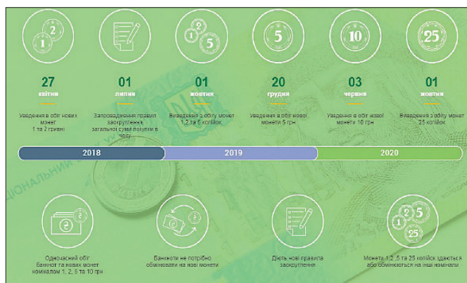
Рис. 9. Инфографика Национального банка Украины 35

Монетный двор введен в эксплуатацию в 1998 году. В соответствии с Указом Президента Украины «Об исключительном праве Банкотно-монетного двора Национального банка Украины» от 10 сентября 1996 г. 34 Банкотно-монетному двору (далее: БМД) было предоставлено исключительное право на осуществление деятельности относительно обеспечения потребностей НБУ в банкнотах и монетах массового обращения. Благодаря этому наше государство имеет полностью завершённый цикл производства.