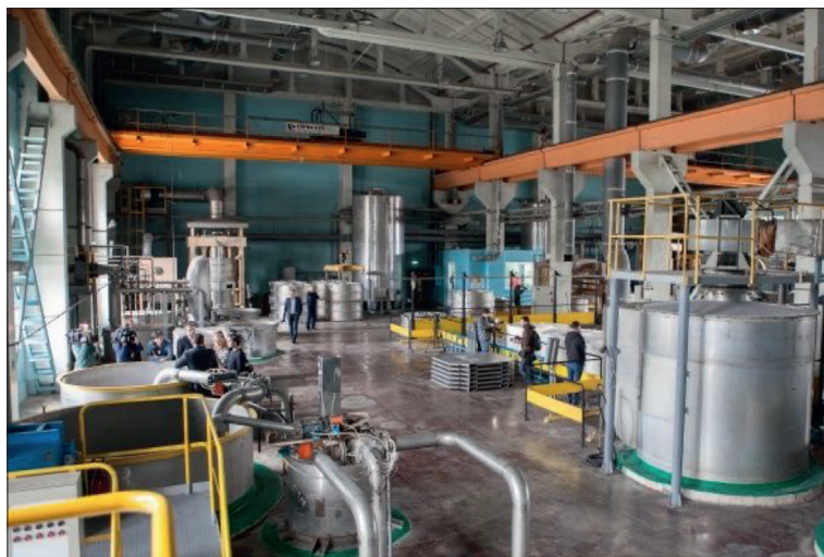
Рис 5. Фабрика банкнотной бумаги НБУ. 27

Готовые листы бумаги упаковывают и отгружают на Банкотно-монетный двор. Практически все процессы на производстве автоматизированы.