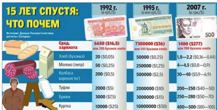
Рис.3 Покупательная способность населения Украины 15