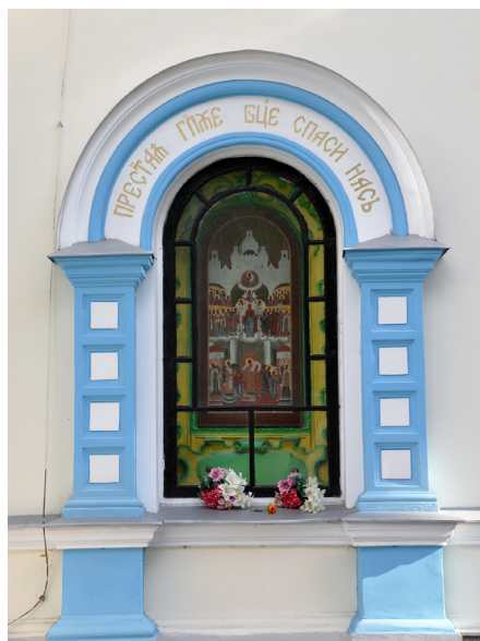
Фото 4. Икона Покрова на северной стене колокольни

В нише северной стены колокольни находится икона Покрова, также написанная И. Михайловым. Она помещена в киот, сделанный в форме высокой арки с прямоугольными пилястрами и дугой вверху. На дуге арки надпись по-церковнославянски: «ПРЕСВЯТАЯ ГОСПОЖЕ БОГОРОДИЦА СПАСИ НАС».