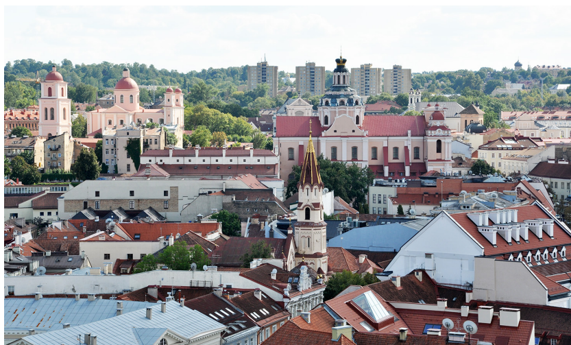
Фото 7. Покровский храм в панораме Вильнюса. Вид с колокольни костела Св. Иоаннов. Фото Г. Поташенко 2019 г. Восточный купол Покровской церкви возвышается вдали между двумя тринадцатипятиэтажными домами в Науйининкай

В настоящее время Покровская церковь видна в панораме южной части города с вертикальной доминанты Старого города – с колокольни костела Св. Иоаннов, самого высокого места в Старом городе Вильнюса (68 м). Старообрядческий храм с высокой колокольней на холме четко выделяется в восточной части Науйининкай. Но все-таки с течением времени рядом с ним оказались и другие пространственные акценты: пять многоэтажных домов, построенных в 1970-х гг., и православная Александро-Невская церковь, восстановленная в 2012 г.