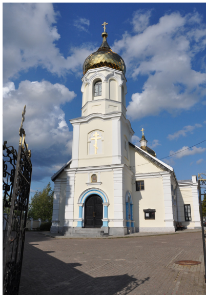
Фото 1. Свято- Покровский храм в Вильнюсе. Фото Г. Поташенко, 2019 г.

ской земле построили свою «тайную» церквушку. Тогда ее освятили, видимо, во имя святителя Николы. Это был первый старообрядческий моленный дом, расположенный тогда неподалеку от Вильнюса, в предместье Острый конец (Островортный форштадт) за городским валом, затем Новый Свет (ныне Науйининкай/Расос), ставшем частью города лишь в начале XX в. После нескольких реконструкций эта деревянная моленная служила ВСО до октября 1901 г., когда было освящено здание нового Покровского храма, расположенного неподалеку, на вершине холма, у подножья которого и находилась старая церковь.