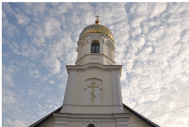
Фото 2. Верхняя часть колокольни увенчана луковичным куполом и восьмиконечным крестом. Фото Г. Поташенко, 2019 г.

На колокольне и восточном куполе, пристроенных в 1905–1906 гг., использованы также элементы национального русского стиля. Это было очень популярно в русской культуре «серебряного века» на рубеже XIX–XX вв. и с учетом неоклассицизма основного здания храма хорошо вписывалось в общеевропейский fin de siècle («конец века»). Сочетание этих архитектурных стилей модерна создает приятное многоголосие, точнее, двухголосие, гармонично дополняющее друг друга. Архитектурные формы Покровского храма подчеркивают молитвенное настроение и тонкое понимание красоты природы, окружающей Вильнюс: холмы, склоны, поросшие деревьями, и небо, часто покрытое облаками.