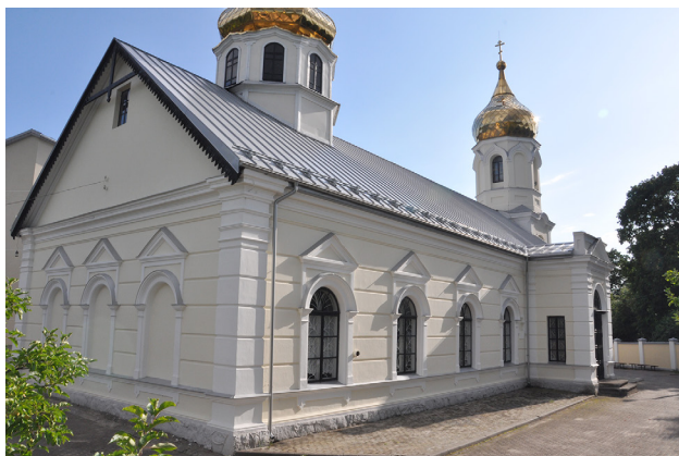
Фото 3. Вид на восточный и северный фасады храма. Фото Г. Поташенко, 2019 г.

На восточном фасаде находятся три стенные ниши (ложные окна) с арочным обрамлением и треугольным сандриком; оно такое же, как и декор окон на боковых фасадах. Окна на боковых фасадах обрамлены пилястрами, над которыми имеются полукруглые архивольты (выступающая обрамлением дуга арки). Каждое окно увенчано треугольным сандриком, а под окном – декоративные наличники под нижним карнизом.