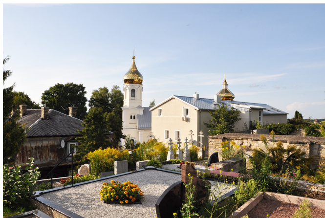
Фото 6. Вид на Покровский храм и его комплекс с южной стороны. 2019 г.

Для староверов храм – это молитвенное место, Божий дом и религиозное состояние души, просветленное солнечной природой. Это чувство особенно усиливает расположение Покровской церкви на вершине холма. Храм как знаковое место присутствия Господа Вседержителя и грядущего явления на земле Царства Небесного символизирует образ торжественной небесной архитектуры. Сочетание устремленной вверх колокольни, архитектурных элементов храма и его местоположения на холме, возвышающем его над земным городом, акцентирует общую идею прославления и небесного апофеоза. Эта идея напрямую связана с темой триумфального явления Святого града – Нового Иерусалима. Текст Апокалипсиса подробно описывает видение святого города Иерусалима, в конце времен сходящего с небес (Отк. 21: 22). Кроме того, видение Небесного Города, посланного Богом в конце истории, тесно связано с эсхатологическим учением староверов-беспоповцев о «конце света», их важной богословской идеей и чертой мировоззрения.