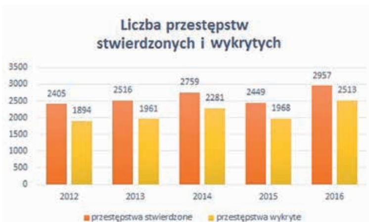
Wykres 2. Art. 190a § 1 k.k. – liczba przestępstw stwierdzonych i wykrytych

Wykres 1 przedstawia struktury przestępstw stwierdzonych z art. 190a k.k. Należy zauważyć, że odsetek przestępstwa uporczywego nękania z roku na roku obniżał się. W 2012 r. aż 9 na 10 czynów zabronionych z tego artykułu dotyczyło stalkingu, natomiast w 2016 r. odsetek ten zmniejszył się aż o 20% w porównaniu z rokiem 2012. Zaobserwować można za to trzykrotny wzrost udziału przestępstwa podszywania się pod inną osobę – z 10,4% w 2012 r. do 30,4% w 2016 r.