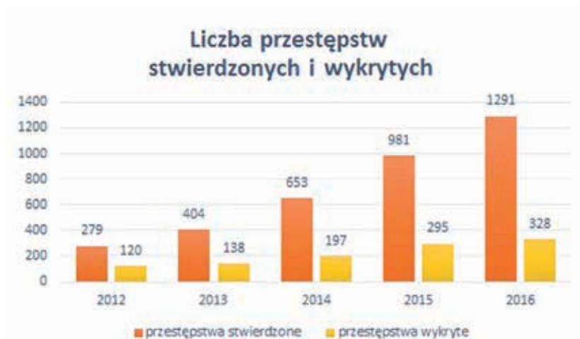
Wykres 3. Art. 190a § 2 k.k. – liczba przestępstw stwierdzonych i wykrytych