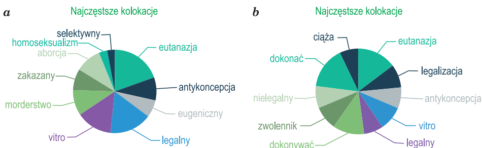
Wykres 3. MoncoPL – najczęstsze kolokaty leksemu aborcja a) forma mianownikowa, b) wszystkie formy fleksyjne

Na podstawie najczęstszych kolokatów leksemu aborcja można już mówić o istotnych różnicach między dyskursem do 2010 r. a dyskursem późniejszym (por. wykres 3.). Różnice nie tyle dotyczą występowania lub niewystępowania określonych kolokatów, ile ich rangi.