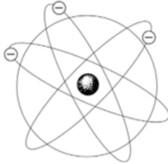
Ryc. 2. Model atomu Ernesta Rutherforda

przeprowadziwszy w 1909 r. z dwoma swoimi studentami (Hansem Geigerem i Ernestem Marsdenem) eksperymenty nad rozpraszaniem cząstek \alpha na bardzo cienkiej folii złota „zapropozował własny model budowy atomu, zwany dziś modelem planetarnym” (EduAdmin 2013) (por. ryc. 2).