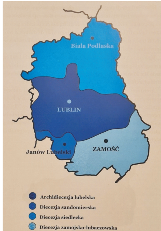
Ryc. 1. Rozmieszczenie kościelnych jednostek administracyjnych w obrębie województwa lubelskiego

Analizowana publikacja należy do klasy komunikatów polisemiotycznych, więc łączy segmenty ikoniczne z werbalnymi. W pełniący rolę wstępu fragment wpleciony jest schemat (rodzaj mapki) ilustrujący relacje między podziałem administracyjnym świeckim (województwo) i kościelnym (archidiecezja i diecezje) (zob. ryc. 1). W pozostałych partiach książki, o czym będzie jeszcze mowa, komponenty ikoniczne towarzyszą werbalnym.