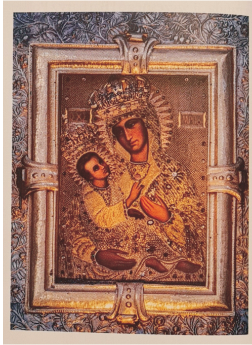
Ryc. 2. Ikona Matki Bożej Chełmskiej

Ważnym komponentem modułu przedstawiającego sanktuarium jest każdorazowo modlitwa. Funkcjonuje w tekście jako segment wyróżniony graficznie przez druk naśladowujący pismo i aplę ukształtowaną na modłę podpalonego zwitka papieru. Nie wykluczone, że modlitwy tego typu są składnikami nabożeństw z udziałem pielgrzymów (zob. Wojtak 2019c: 67–71). Mogą to też być teksty śpiewane przy odsłanianiu lub zasłanianiu cudownego wizerunku. Należą w każdym razie do kategorii modlitw ustalonych (książeczkowych), co determinuje ich poetykę (zob. m.in. Wojtak 2019c: 25–44). Dla przykładu zacytuję modlitwę dopełniającą analizowany do tej pory moduł, dodając nazwy jej znanych komponentów, odzwierciedlających schemat kolekty: (1) tytuł: Modlitwa do Matki Bożej Chełmskiej , (2) anakleza: Dziewico Niepokalana, Matko Zbawiciela i Matko nasza , (3) anamneza: któraś od wieków na siedzibę swoją świątynię na Górze Chełmskiej obrała , (4) prośba: wysłuchaj mego wołania i wzmocnij w mojej duszy wiarę świętą , (5) aklamacja: Amen . Warto jedynie nadmienić, że aklamacja jest umieszczona po drugim analogicznym segmencie (zob. ryc. 3). Jest to klasyczna realizacja modlitwy w formie oracji rzymskiej. Zgodnie z kanonem, choć w tym przypadku alternacyjnie modyfikowanym, jest wysłowiony nie tylko aspekt