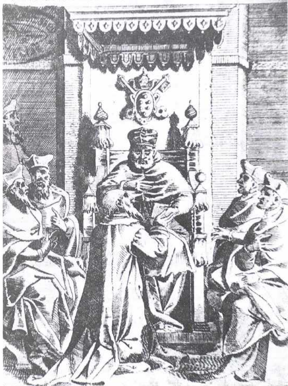
Hozjusz specjalnym wyslannikiem papieza Piusa IV do cesarza Ferdynanda