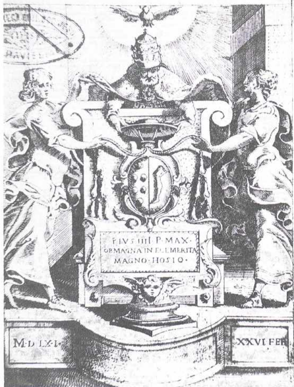
Treter, ryc. 52. Papież Pius IV kreuje Hozjusza kardynałem pod jego nieobecność