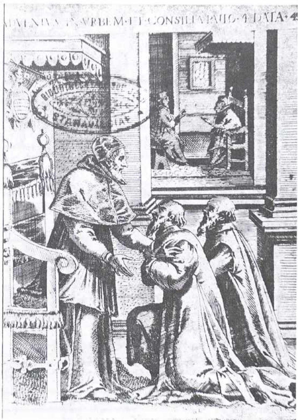
Treter, ryc. 45. Hozjusz na życzenie papieża Pawła IV przybywa do Rzymu