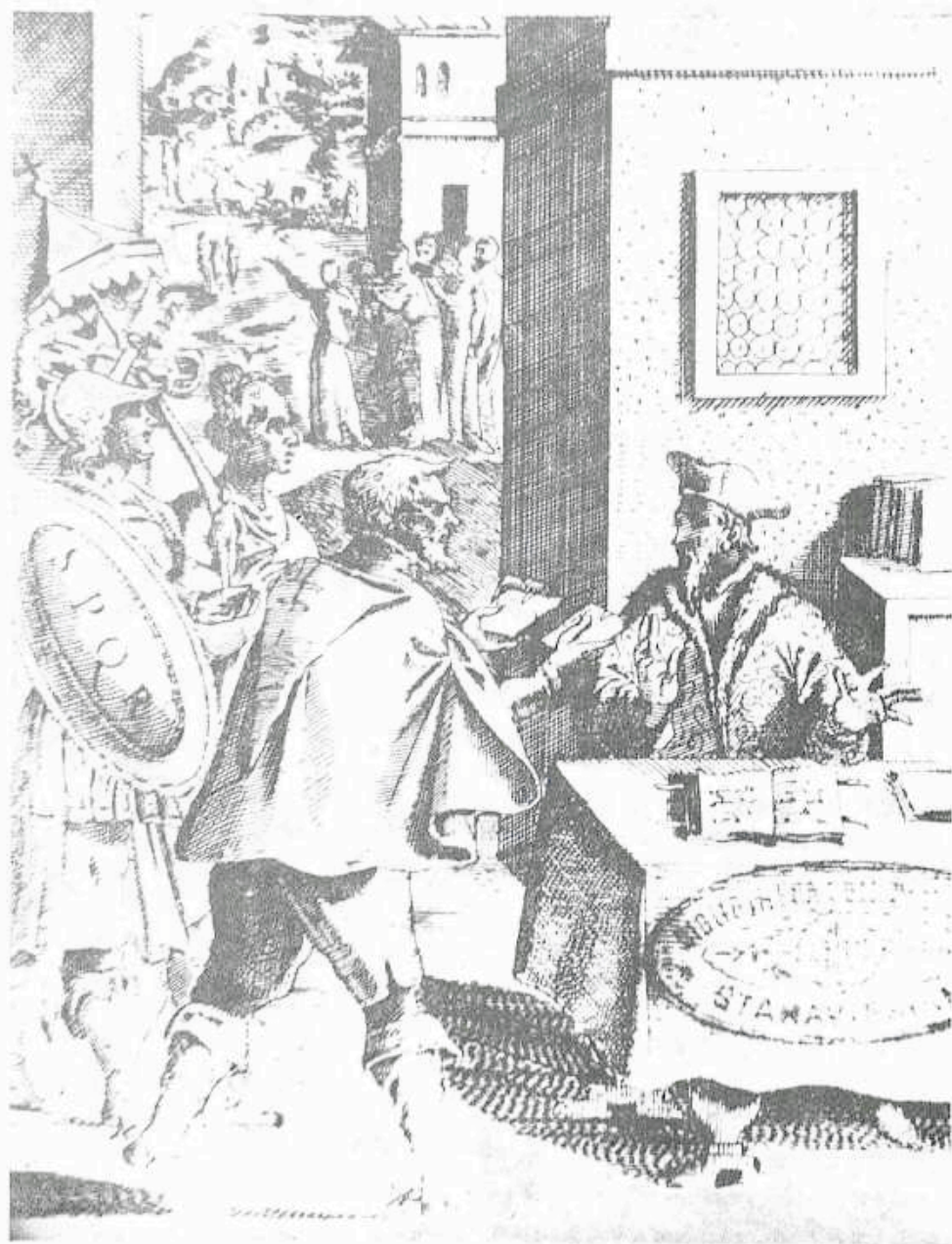
Treter, ryc. 44. Hozjusz otrzymuje list od papieża Pawła IV, wzywający go do Rzymu